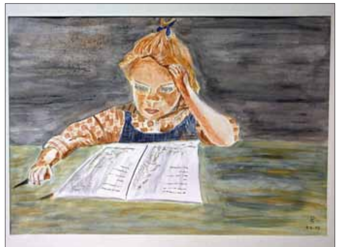
„Lesendes Kind“ von Dagmar Schmidt

Während der Öffnungszeiten der Bibliothek können die Arbeiten von Manuela Heim, Anneliese Kühhirt, Dagmar Schmidt und Maria Weber besichtigt werden.