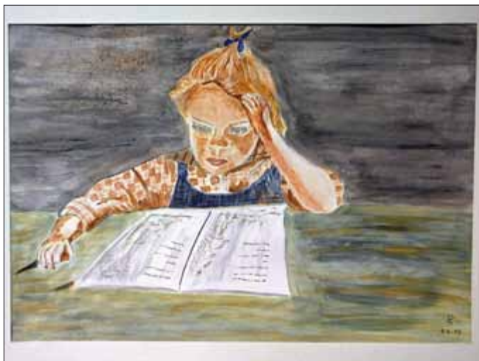
„Lesendes Kind“ von Dagmar Schmidt

Während der Öffnungszeiten der Bibliothek können die Arbeiten von Manuela Heim, Anneliese Kühhirt, Dagmar Schmidt und Maria Weber besichtigt werden.