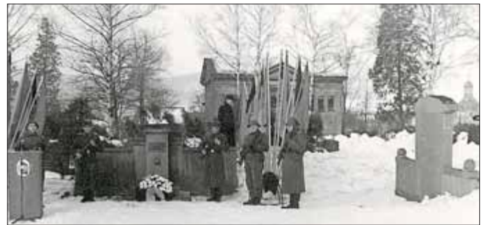
Märzgefallenen Denkmal 1970, im Hintergrund die Leichenhalle

Mündlichen Erzählungen zufolge wurde im Juni 1983 eine Plastik des Kühndorfer Bildhauers Rommel vor dem Denkmal für die Märzgefallenen aufgestellt, die aber 1991 mutwillig beschädigt und später beseitigt wurde.