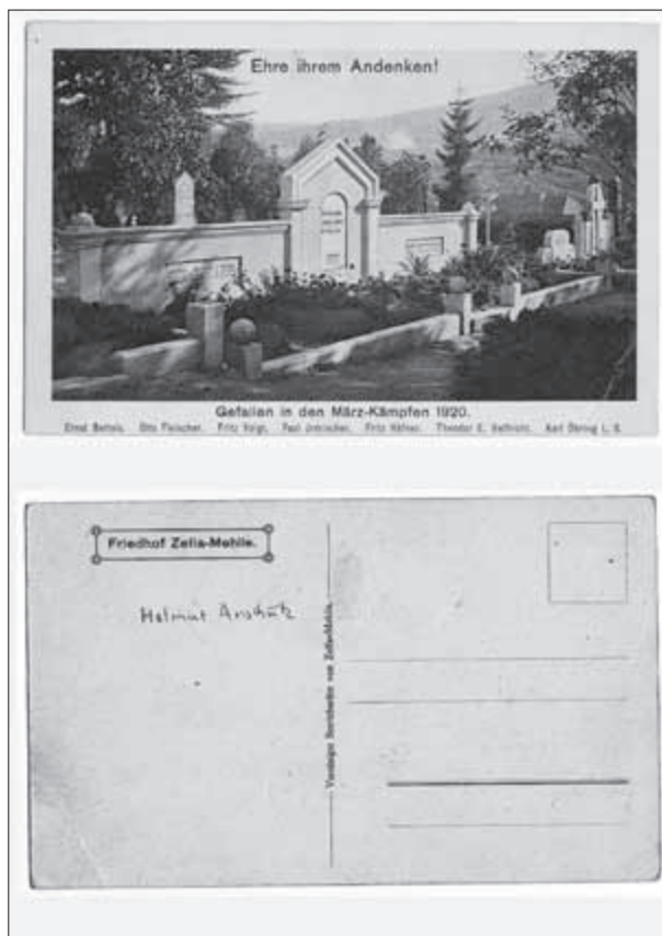
Grabdenkmalanlage für die Märzgefallenen von 1920, Postkarte verlegt von Vereinigte Betriebsräte von Zella-Mehlis