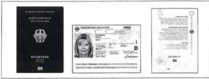
Abb. Darstellung der neuen Reisepassgeneration (Beispiel 32-Seiten-Reisepass)

Folgende Dokumente werden ab 1. März 2017 in einem neuen Design ausgeliefert: