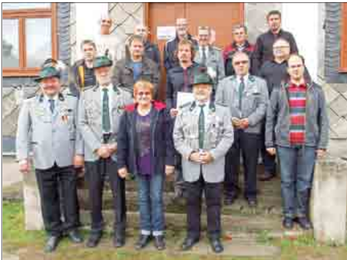
Teilnehmer der Siegerehrung

Der 13. kreisoffene Ranglistenwettkampf 2015 im Kleinkaliberschießen fand mit der Siegerehrung am 04. Oktober 2105 seinen würdigen Abschluss.