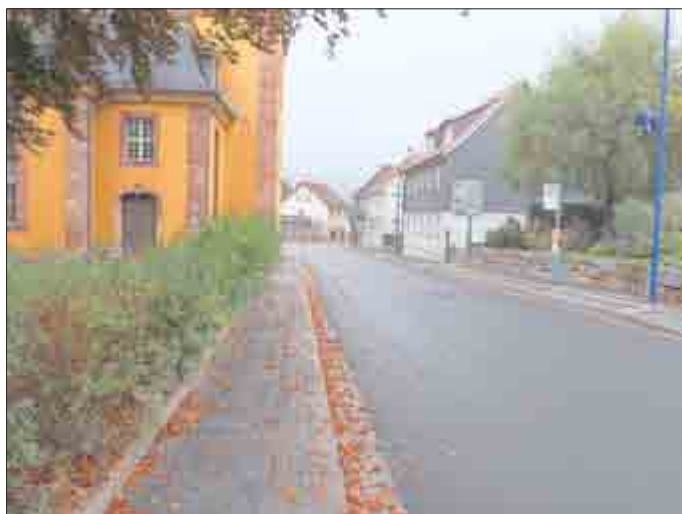
Die neue Haltestelle wird noch überdacht.

Weil sie kaum genutzt wurden, entfallen werktags zwei Spätfahrten (I1: 18 Uhr, I2: 18.40) auch die Sonntagsfahrten (zwei Fahrtenpaare zwischen 13 und 16 Uhr) werden gestrichen. Die Linie I3 wird trotz schwacher Nutzung zunächst unverändert bleiben. Über sie ist das Medizinische Versorgungszentrum an der Ernst-Haeckel-Straße erreichbar.