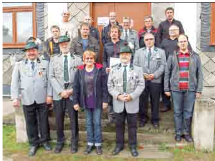
Teilnehmer der Siegerehrung

Der 13. kreisoffene Ranglistenwettkampf 2015 im Kleinkaliberschießen fand mit der Siegerehrung am 04. Oktober 2105 seinen würdigen Abschluss.