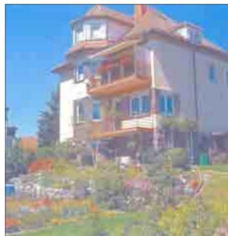
Der schöne Blumenschmuck an der Anspelstraße 64

Der Förderverein Zella-Mehlis war auch in diesem Jahr wieder im Stadtgebiet unterwegs und hat gesucht, welche Häuser dafür sorgen, dass unser Stadtbild so schön ist. Die Bewohner beziehungsweise Eigentümer sind beim Stadtfest ausgezeichnet worden.