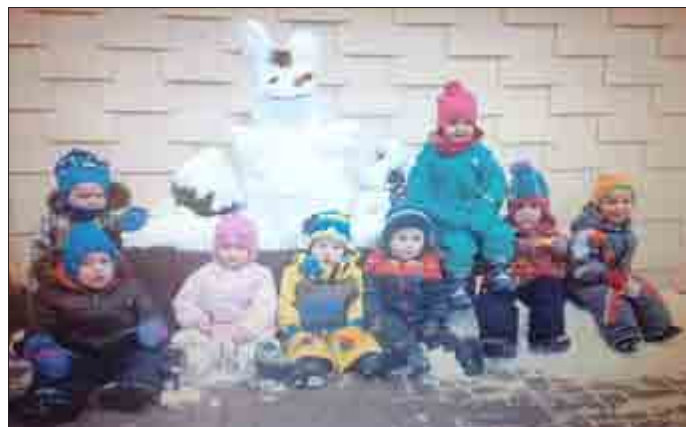
Die Kindergartenkinder mit ihrem Schneehasen