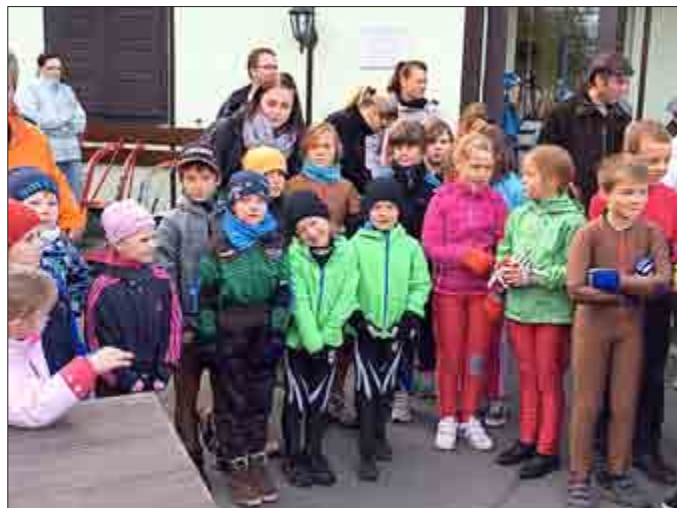
Bu: Herbstpokal Jugend E und D

Die Zella-Mehliser Rennrodler sind für den Winter gut gewappnet. Nach den Vorbereitungen im Sommer hoffen wir in allen Altersklassen, in denen Zella-Mehliser Rennrodler starten auf gute Ergebnisse. Die Sportler der Jugend A bis E hatten bereits im September ihre ersten Bewährungsproben auf der Sommerrodelbahn in Ilmenau.