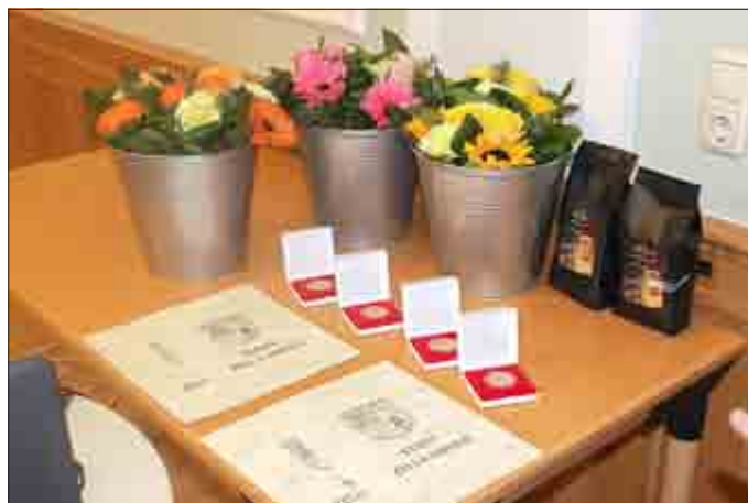
Die Preisträger erhalten Medaille, Urkunde und eine Geldprämie

Um auch die Lehrlinge zu erfassen, die zwar in Zella-Mehlis wohnen, aber ihre Ausbildung in einem anderen Landkreis oder Bundesland absolvierten, bestand auch 2015 die Möglichkeit, Meldungen durch jedermann an den Verein oder die Stadtverwaltung zu geben. Leider wurde dieses Angebot wiederum wenig genutzt.