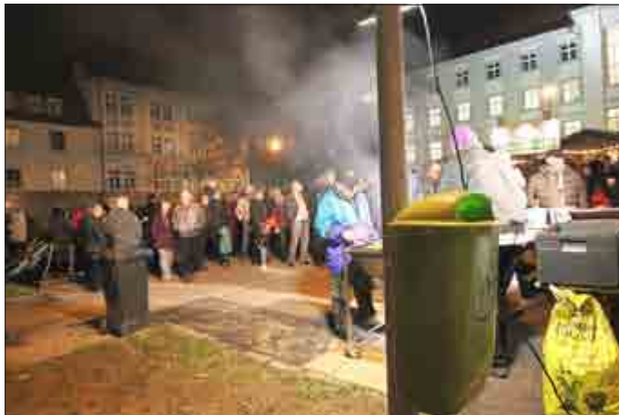
Auch 2014 war viel los auf dem Rathausparkplatz

Mit einem verkaufsoffenen Sonntag setzt der Gewerbeverein Zella-Mehlis das mittlerweile zur Tradition gewordene „ Lichterfest “ fort. Es ist nun bereits die 6. Veranstaltung. Der Erfolg und Zuspruch zu den ersten fünf Veranstaltungen lässt auch 2015 auf eine gute Resonanz in der Bevölkerung sowohl zum verkaufsoffenen Sonntag wie auch zur kleinen Abschlussveranstaltung auf dem Rathausparkplatz hoffen.